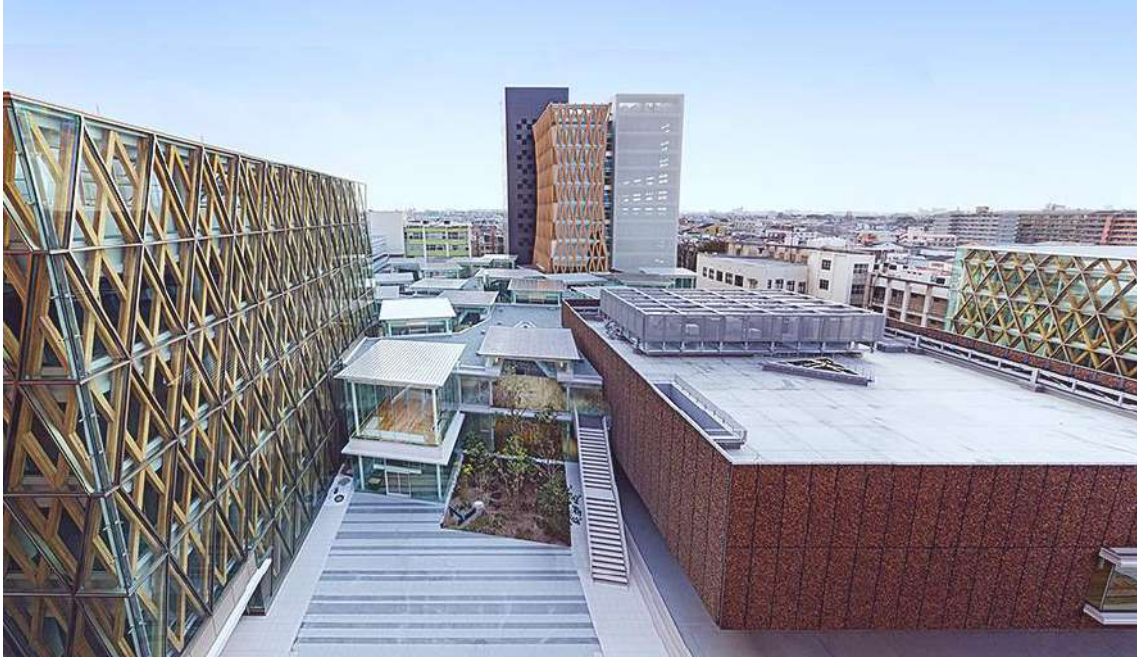
- ACADEMIC THEATER

学長は細井美彦氏である。京都大学農学部畜産学科卒、同大学大学院修士・博士課程修了。農学博士。近畿大学では1993年生物理工学研究所講師、97年生物理工学部助教授、2002年から教授、2010年から生物理工学部長、先端技術総合研究所長、副学長を歴任。2018年4月から現職。専門は生殖生理学である。