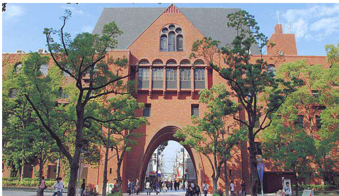
西門、大学のシンボルともいえるレンガ造りの門

建学の精神としては、未来志向の「実学教育と人格の陶冶（とうや）」を掲げており、この精神を実現するための教育理念としては「人に愛される人、信頼される人、尊敬される人の育成」を標榜している。