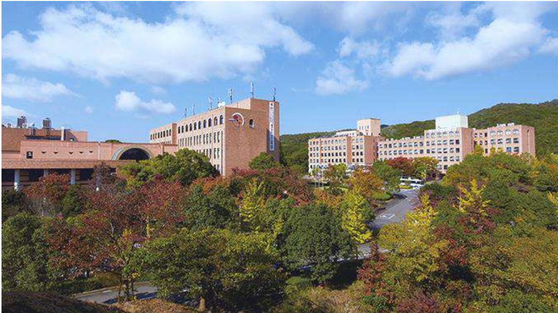
生物理工学部（和歌山県）

医学部は1974年に設立された。「人に愛され、人に信頼され、人に尊敬される」医師の育成を目指す。総合大学の医学部として、文理融合プログラムや薬学部との合同講習会などを通して、倫理とプロフェッショナリズム、コミュニケーション能力など医師としての人格形成に努めている。ライフサイエンス研究所、東洋医学研究所などの研究施設や近畿大学病院などを抱えている。