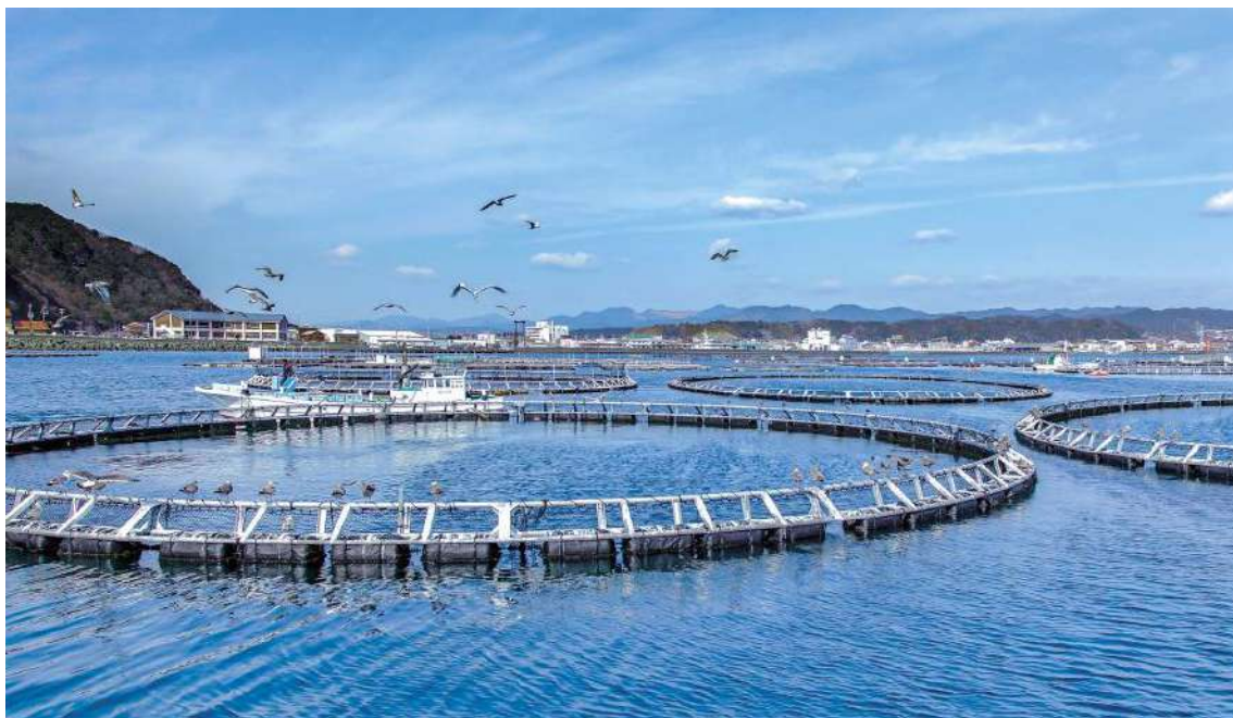
近畿大学水産研究所

近年、大学の名を高めたのが、海のダイヤとも言われるクロマグロの養殖の成功であろう。大学では1948年に和歌山県白浜に臨界研究所を設置、養殖法の研究に着手。ヒラメの人工ふ化に始まり、1970年からはクロマグロの養殖研究が始まった。クロマグロの完全養殖に成功するまでには30年以上の試行錯誤があった。完全養殖に成功したのは2002年、04年には初出荷した。2013年からは、養殖マグロやタイなどの養殖魚専門料理店「近畿大学水産研究所」を大阪や東京などに店、人気を博している。