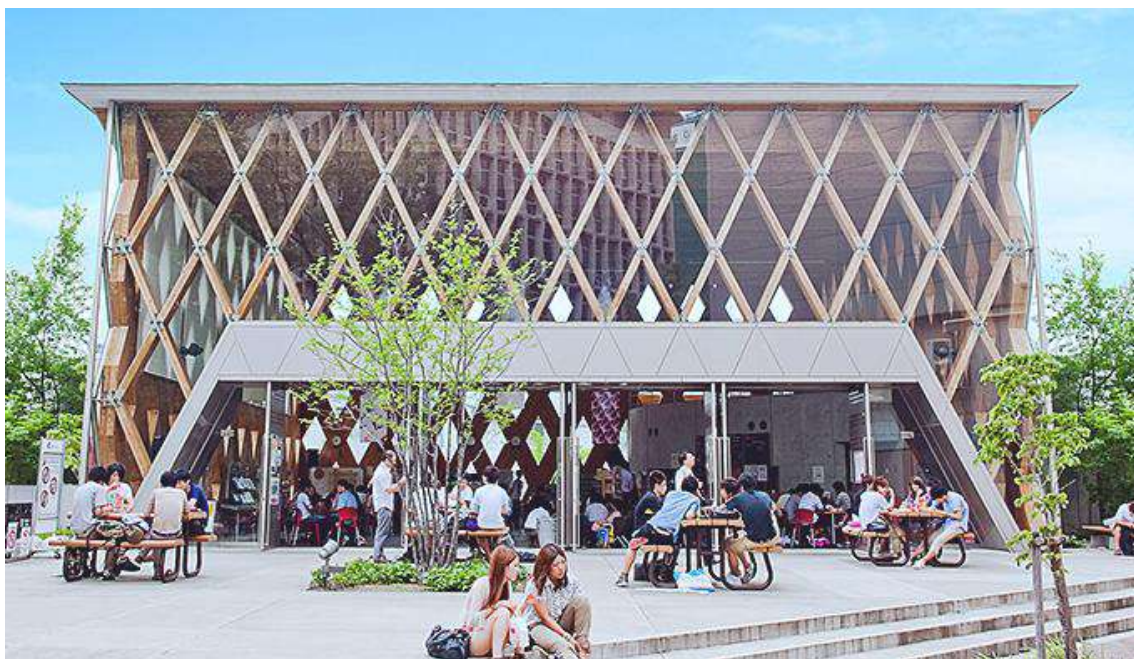
英語村 E3[e-cube]、誰もが気軽に“英語”に触れられる施設。

義と共通にしており、留学生と一緒に学ぶことができる。「専門科目」には、「言語入門」、「コミュニケーション学」、「多様性と世界を理解する視点」、「グローバル・イシュー入門」、「アジア学入門」、「地域研究入門」があり、3年次以降の専門性を求める学習への適切な導入となっている。「グローバル専攻」と「東アジア専攻（中国語コース、韓国語コース）」がある。