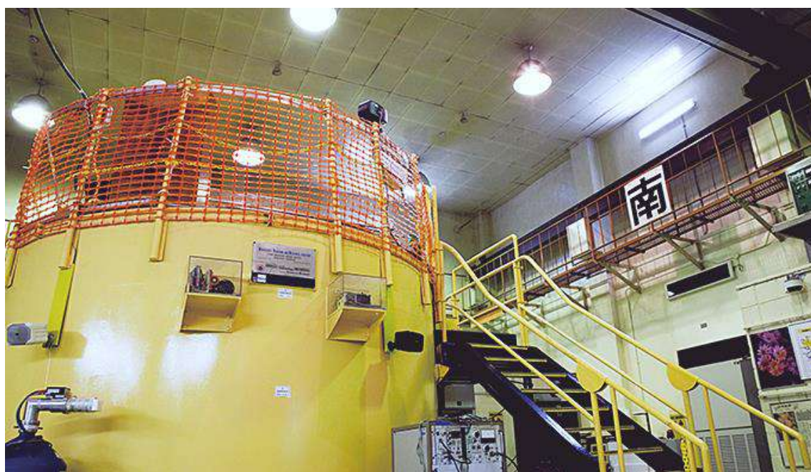
原子力研究所、私立大学で唯一、教育・研究用の原子炉。

大学創立とともに発足した理工学部は当初、数学物理学科、化学科、機械工学科、土木工学科の4学科だった。その後、応用化学科、電気工学科、原子炉工学科、金属工学科、建築学科、電子工学科、経営工学科などが次々に加わり、11学科となった。2002年には11学科を8学科に改組、このうち数学物理学科、化学科を数学、物理学、化学の3コースからなる理学科に改編した。あとは生命科学科、応用化学科、機械工学科、電気電子工学科、社会環境工学科、建築学科、情報学科である。