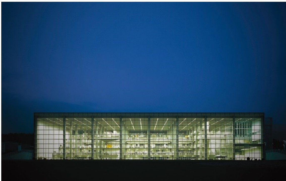
キャンパスの外観

情報科学、情報工学といわれる情報系の専門分野は、半世紀ほど前に確立された比較的新しい学問領域である。システム情報科学とは、そうした20世紀の情報科学の発展を基礎に、21世紀に必要とされる「人間を中心とする」新たな情報科学の総合分野を創成していくことを目指している。複雑な現実世界をできるだけあるがままの対象として取り扱い、数理科学的手法、デザイン的手法、社会科学的手法などを取り入れながら、システムとして表現し制御することを重視している。