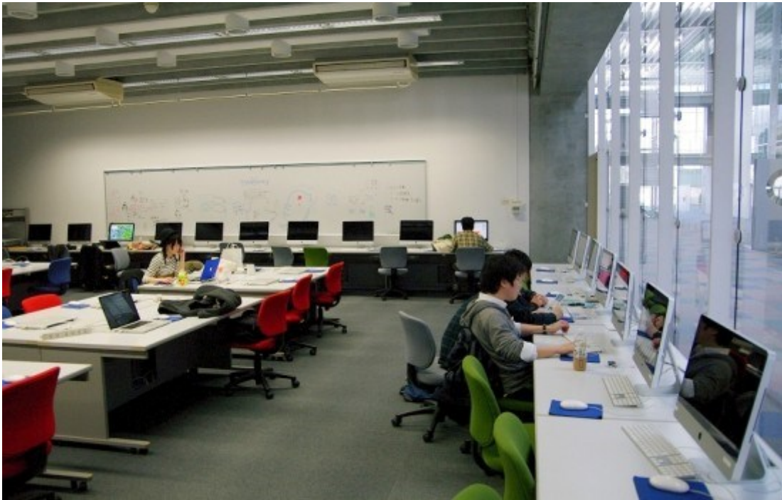
コンピュータ教室