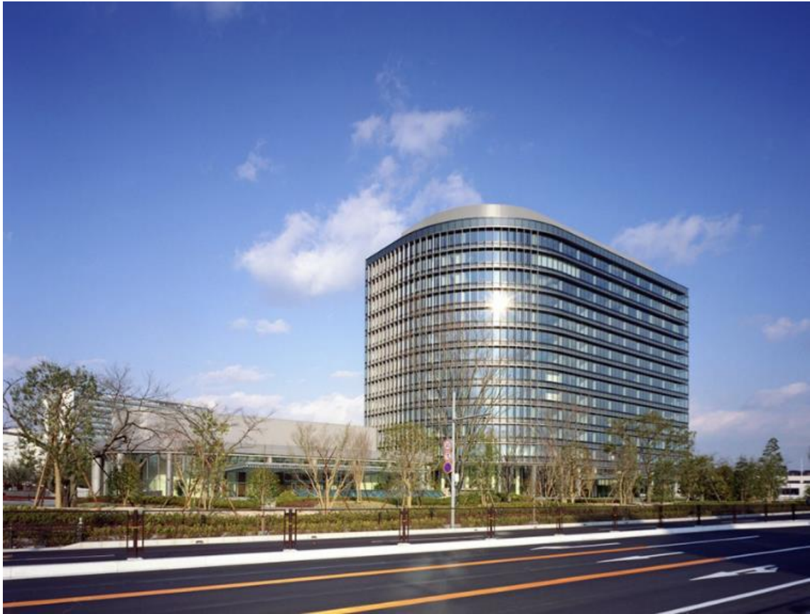
トヨタ自動車本社

トヨタ自動車は、5月1日、11日の2日間、国内15の完成車工場の計28ラインすべての稼働を停止とする、と15日に発表した。加えて堤工場（愛知県豊田市）の第1、第2ラインを5月12~15日の4日間停止させるのをはじめ、愛知県、静岡県、岩手県、東京都にある5完成車工場計9ラインの稼働を5月12日から1~5日間停める。このほか愛知県、東京都、岐阜県にある3工場の計4ラインを5月と6月も2カ月間通常の2直体制から1直体制に縮小する。さらに、一部の海外部品の納入に影響が出ることを見込み、4月20日~4月22日の3日間、愛知県の2工場で計3ラインの稼働も停止する。