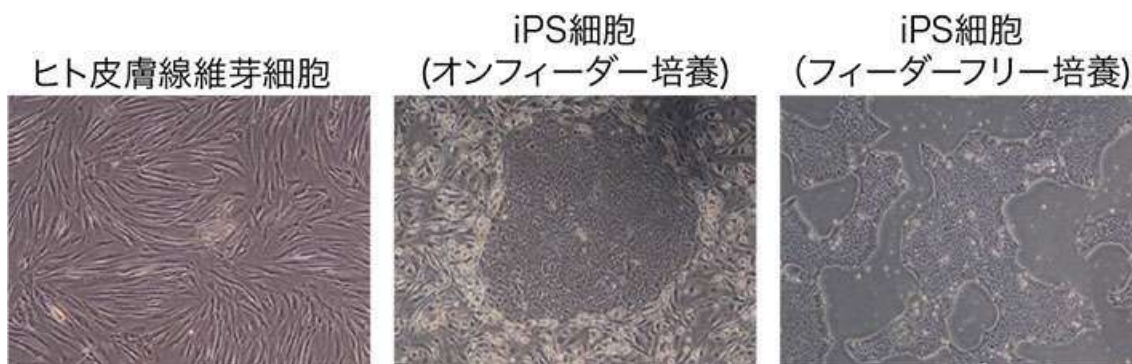
図 1. 今回の研究で用いた細胞の明視野顕微鏡像

一方で iPS 細胞は様々な細胞に変化する能力を持ち、臓器再生や疾患治療などへの応用が期待されるが、同時に iPS 細胞自身のがん化する懸念が残っており、がん化するメカニズムの解明が急務となっている。一般的に細胞のがん化の原因は DNA に生じた「傷」が原因であり、通常は DNA 修復機構により修復されるが、iPS 細胞における DNA 修復機構の制御機構は不明だった。そこで iPS 細胞における DNA 修復機構など DNA を守る分子の仕組み解明を試みた。