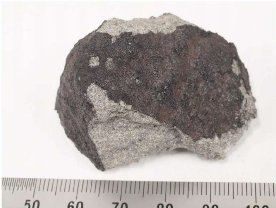
最初に発見された破片