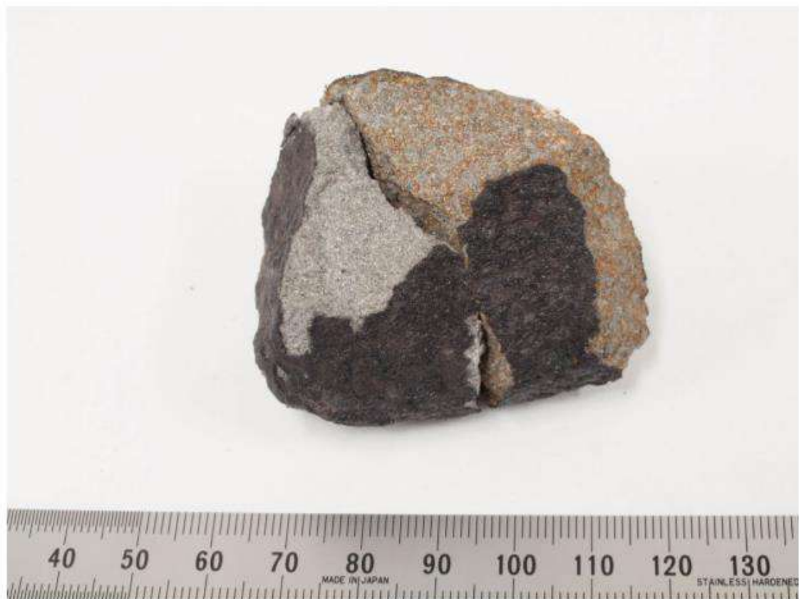
習志野隕石（仮称；回収された 2 つの破片を組み合わせた写真）

7 月 2 日(木)2 時 32 分頃、千葉県習志野市のマンションに隕石が落下した。宇宙線生成核種からのガンマ線を検出し隕石であることを確認した。今後、分類を確定し、国際隕石学会に名称を「習志野隕石」として登録申請する予定である。