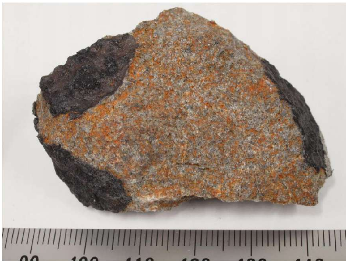
2 番目に発見された破片