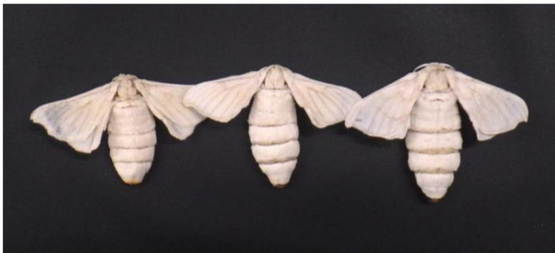
図3 眠性変異体のカイコ成虫。左から、3回、4回、5回の幼虫脱皮を行う系統。脱皮回数が減ると小さな成虫となり、増えると大きな成虫となる。3回脱皮する系統の吐糸は細くしなやかで付加価値が高い。

一般に、カイコの幼虫は4回の幼虫脱皮を行う4眠蚕(よんみんさん)であり、5齢幼虫になってから蛹へと変態します。しかし、カイコには幼虫脱皮の回数が増える眠性変異体が存在します(図3)。