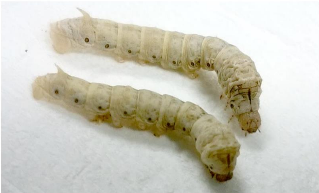
図2 カイコの標準系統の幼虫。下の個体は「眠」に入った脱皮期の4 齢幼虫。上の個体は脱皮を終えた5 齢幼虫。「四度の眠」を経ると5 齢(終齢)となり、大量の桑の葉を食べ、やがて絹糸を吐いて繭をつくる。