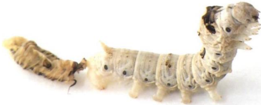
図1 脱皮直後のカイコ幼虫(5 齢)。幼虫の左側には脱皮殻(脱皮によって脱ぎ捨てられた皮膚)が、右側には4 齢の時の頭殻(頭の殻)が、それぞれ残されている。