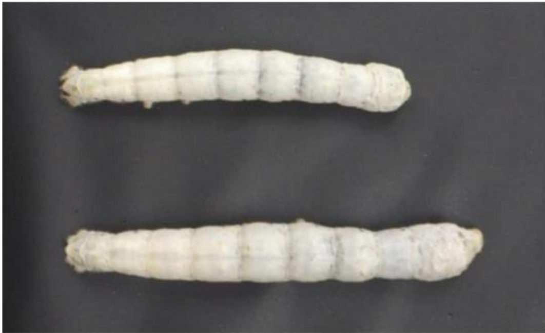
図 4 ゲノム編集によって 5 回脱皮するように改変されたカイコ。

上は標準系統の 5 齢幼虫(終齢)。Scr 遺伝子の構造の一部を破壊すると過剰脱皮が誘導されて巨大な 6 齢幼虫へと成長する(下の個体)。