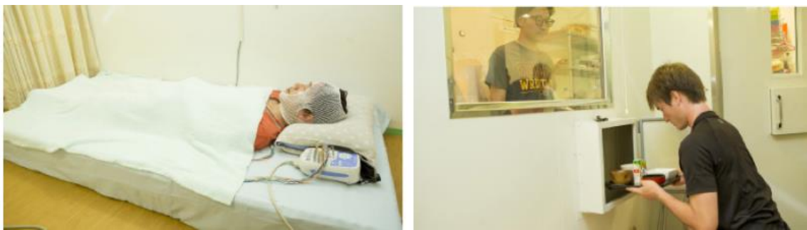
図1 睡眠検査とヒューマン・カロリメータでのエネルギー代謝試験

本研究では、烏龍茶(カフェイン 51.8mg、重合ポリフェノール 62.3mg、カテキン類 48.5mg、没食子酸 10.7mg、市販烏龍茶 350mL 相当量)、カフェイン(51.8mg)のみ、およびプラセボ飲料、の3種類について、毎日それぞれを朝食と昼食時に摂取し、2週間目に睡眠と1日のエネルギー代謝を測定しました。健常男性 12 名を被験者とし、二重盲検ランダム化比較試験を行いました。