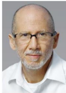
バート・フォーゲルシュタイン博士