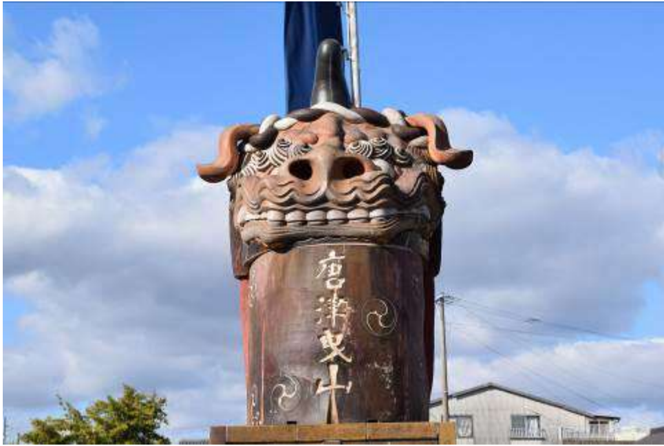
唐津焼の曳山の正面図