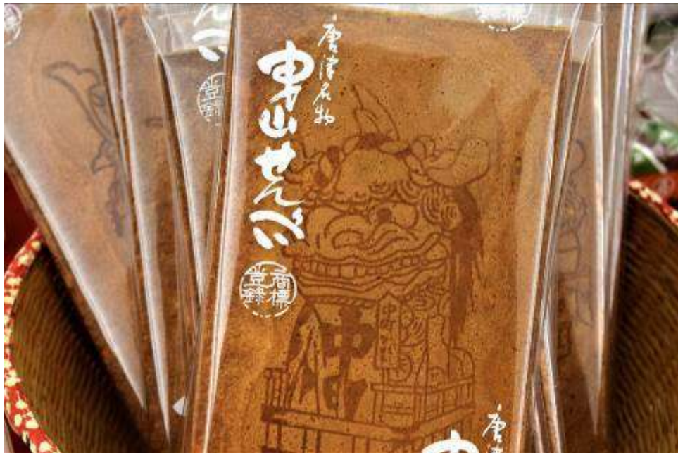
唐津名物 曳山せんぺい！