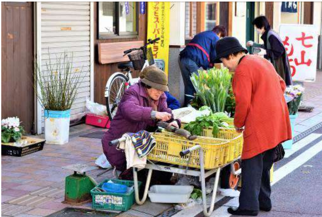
農家から売りにくるこの蓮根は新鮮で美味しい。