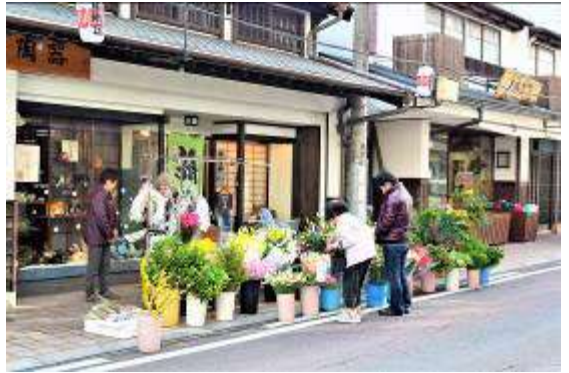
ここは中町商店街 露店は朝から午前中までのようだ！