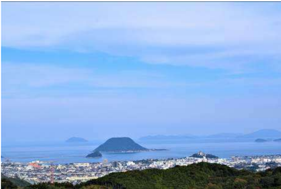
山から見た唐津市と海