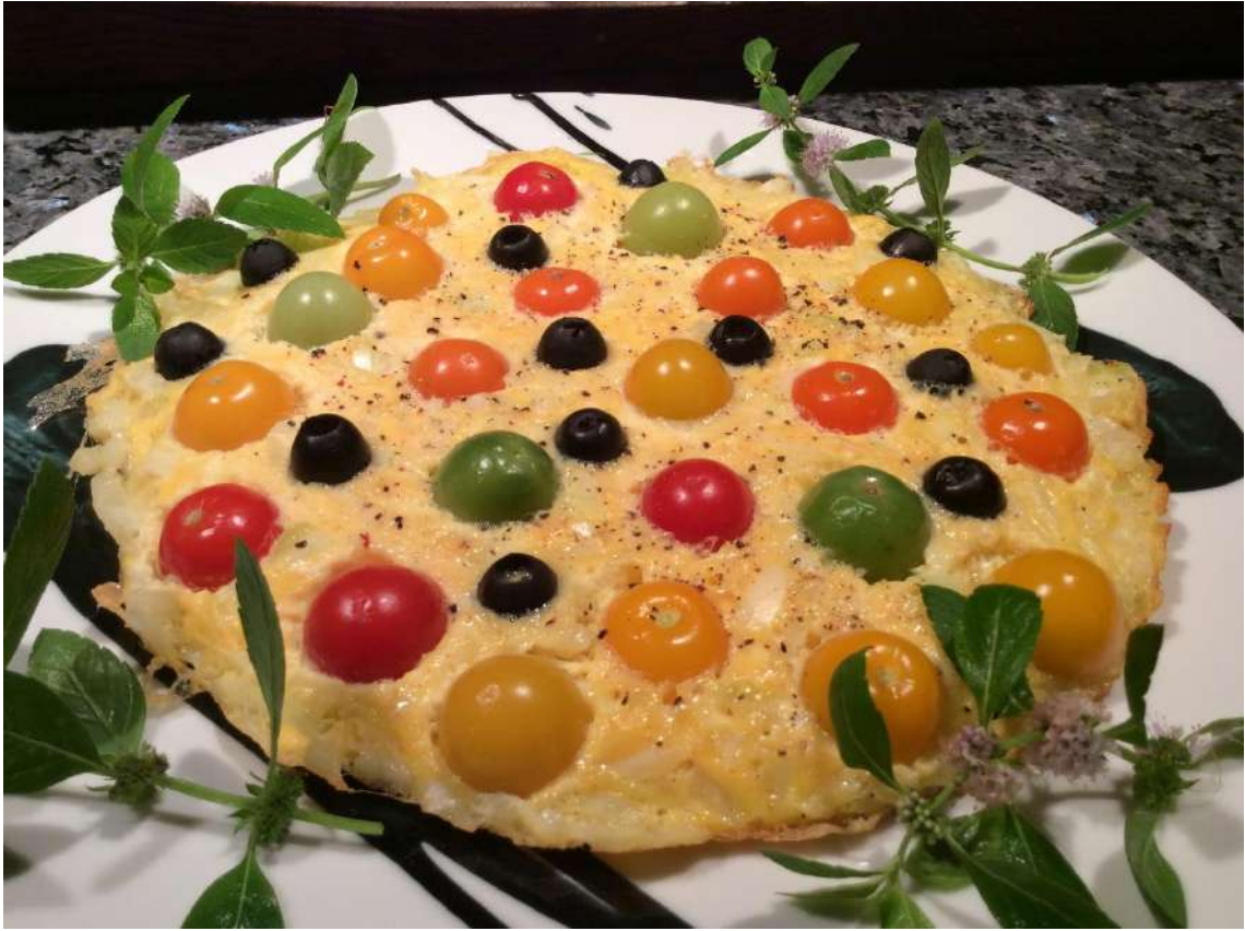
色を工夫して並べるトマトオムレツ