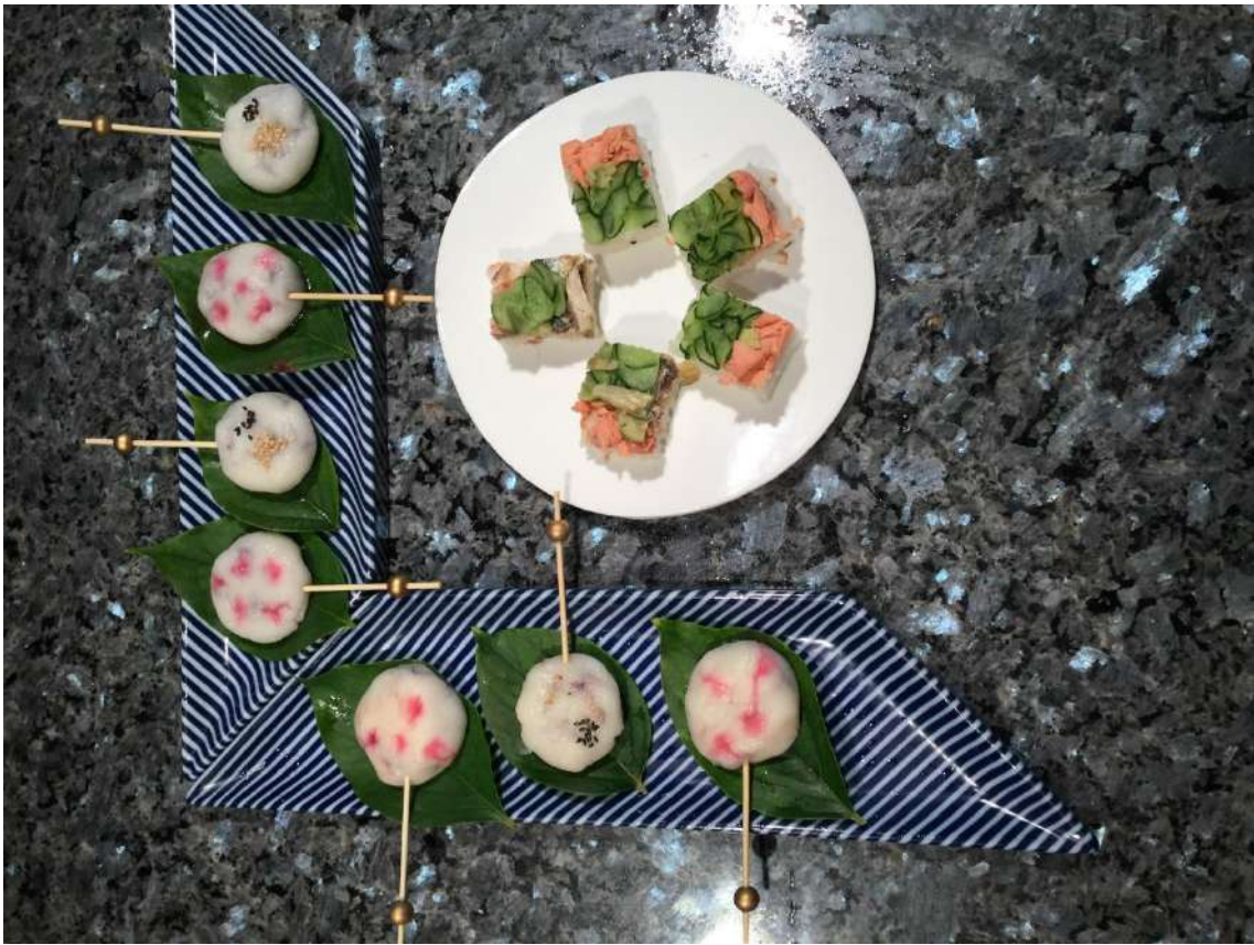
円と四角で楽しむ

セルクル寿司、つまり輪っかに寿司飯を入れて丸くした上に、鮭や卵、キュウリ他のいろいろな具をのせたお寿司です。