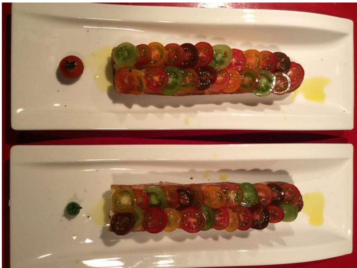
ミニトマトのサラダ

横に薄めに切ったフィセル（バゲットの小さい版）にオリーブオイルを垂らしてサッと焼き、スライスしたミニトマトを好きなように彩りよく並べて、塩、胡椒とオリーブオイルをかけただけのものです。